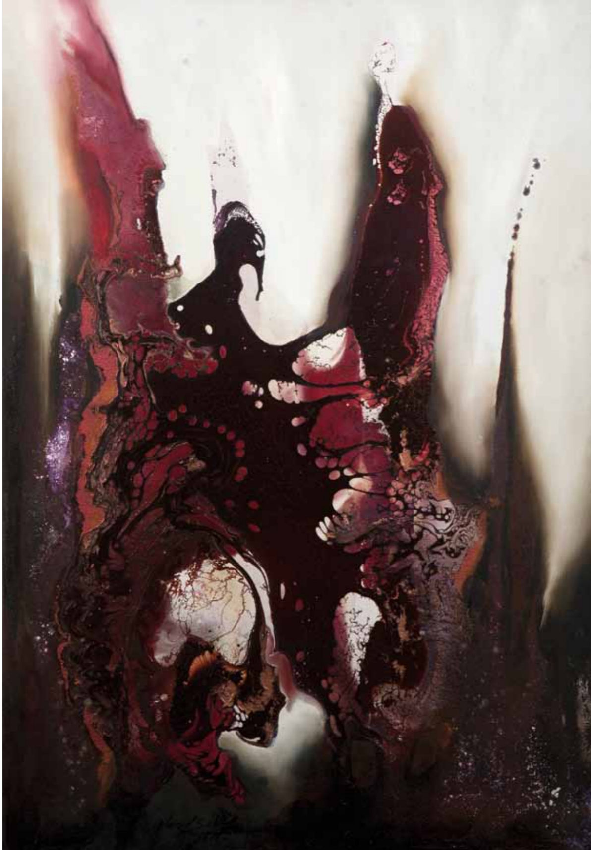
Ferveur 1. Cire, pigments, glacis et huile sur toile. 100/70cm 2016