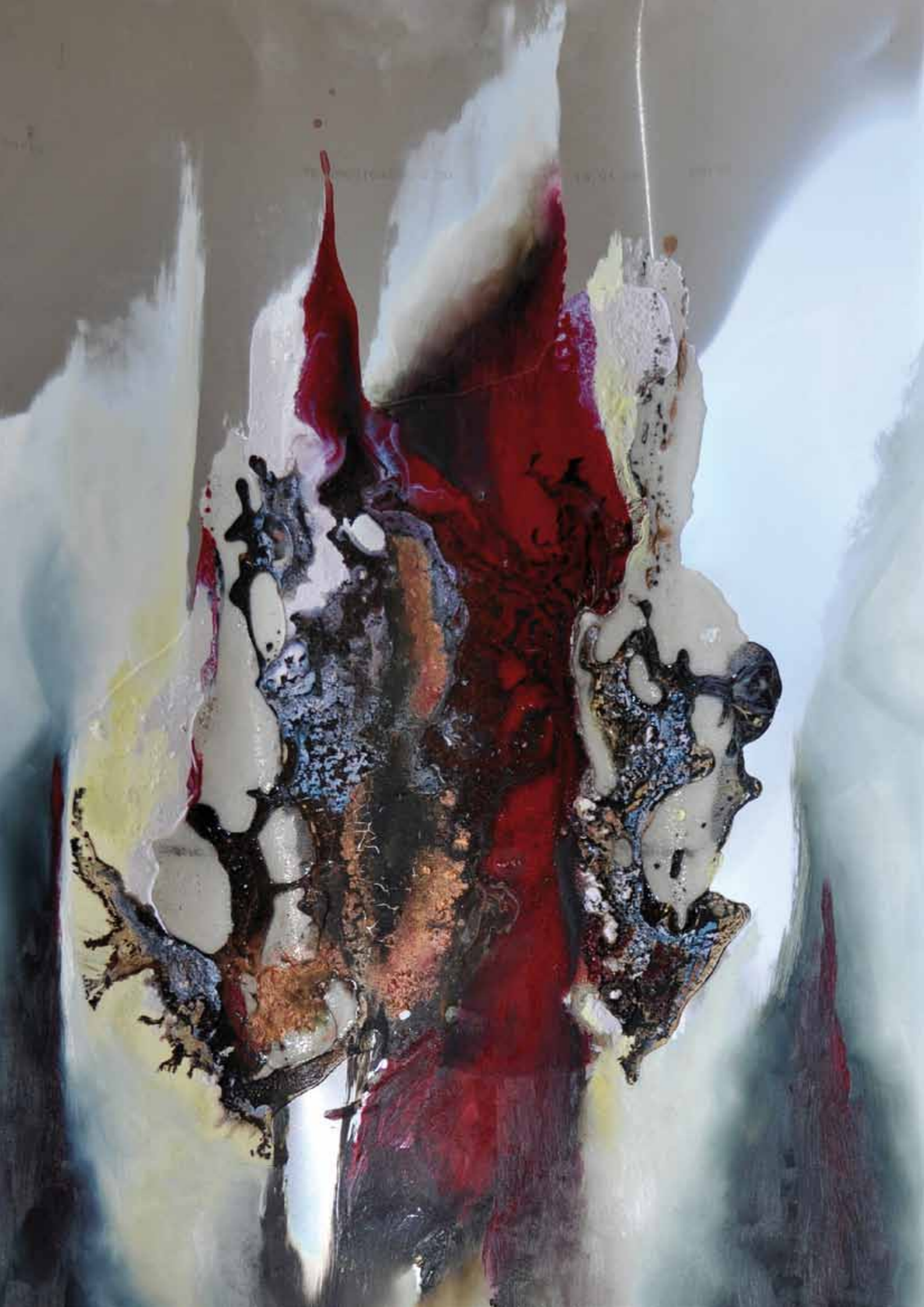
Série miroir Rouge Mixte sur feuille d'aluminium argentée. 74/59cm 2014