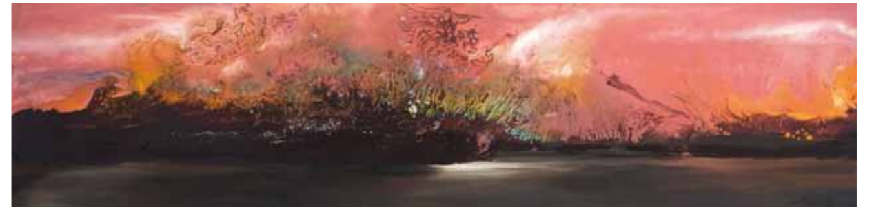
Le chemin d'Ariane . Cire d'abeille, pigments, nacre et huile sur toile. 40/160 cm 2016