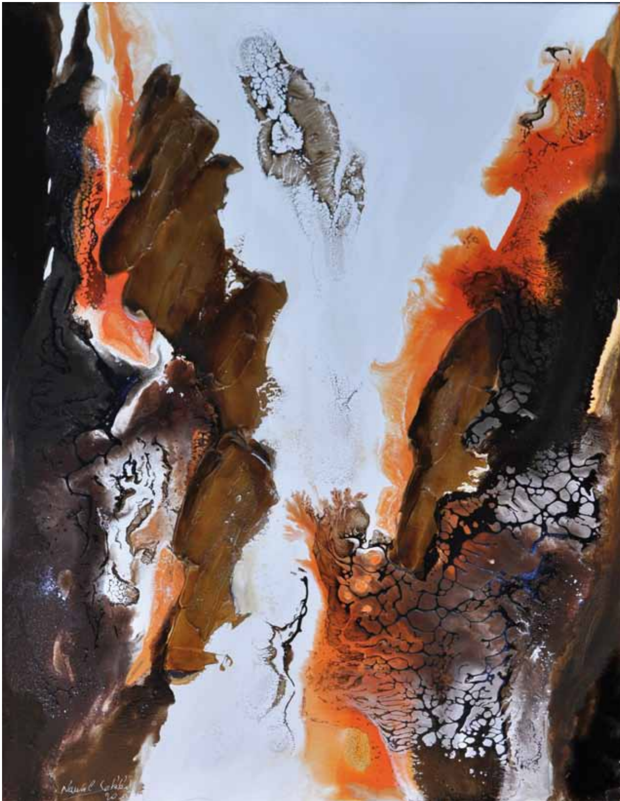
Mon Tendre Amour. Œuvre du livre . Nuit d'espérance. 80/60cm 2015