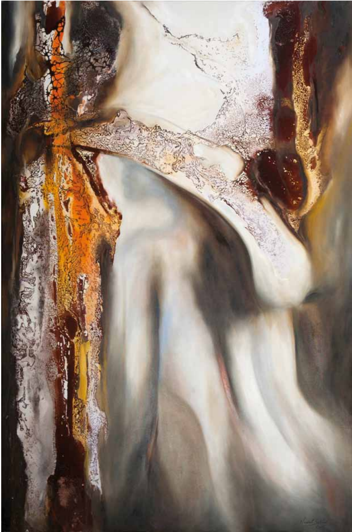
L'aube blanche! sérénité. Technique résine, huile, pigments, nacre et cire d'abeille sur toile. 180/120cm. 2016