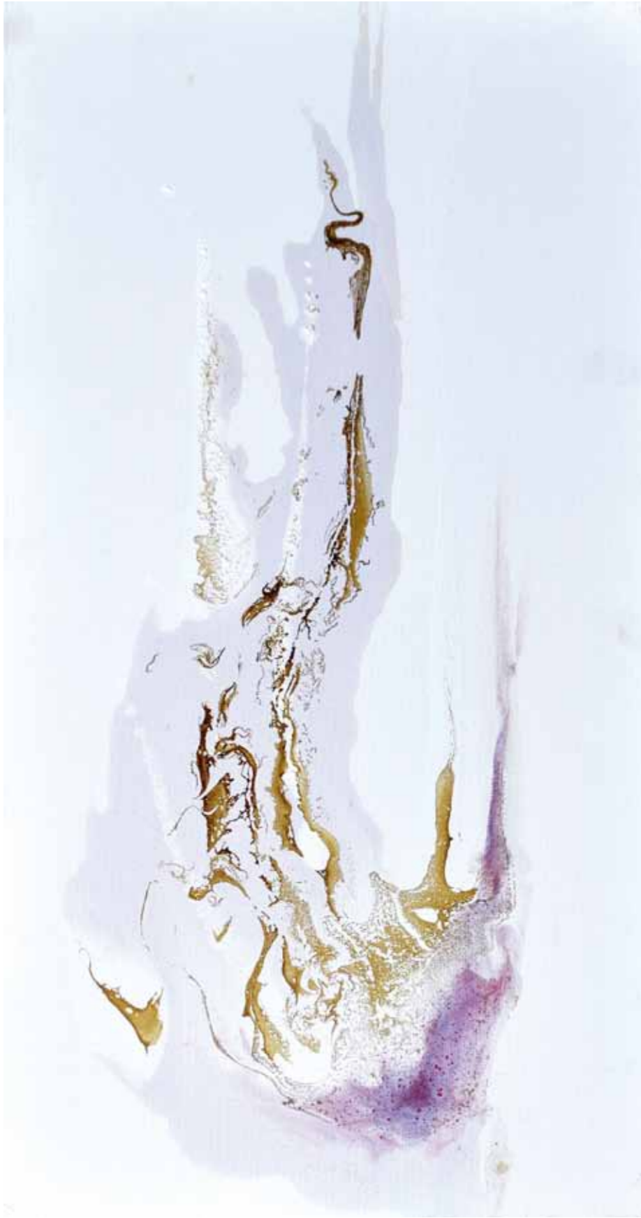
Ca s'en va l'Amour. Œuvre du livre . Nuit d'espérance. 30/60cm 2015