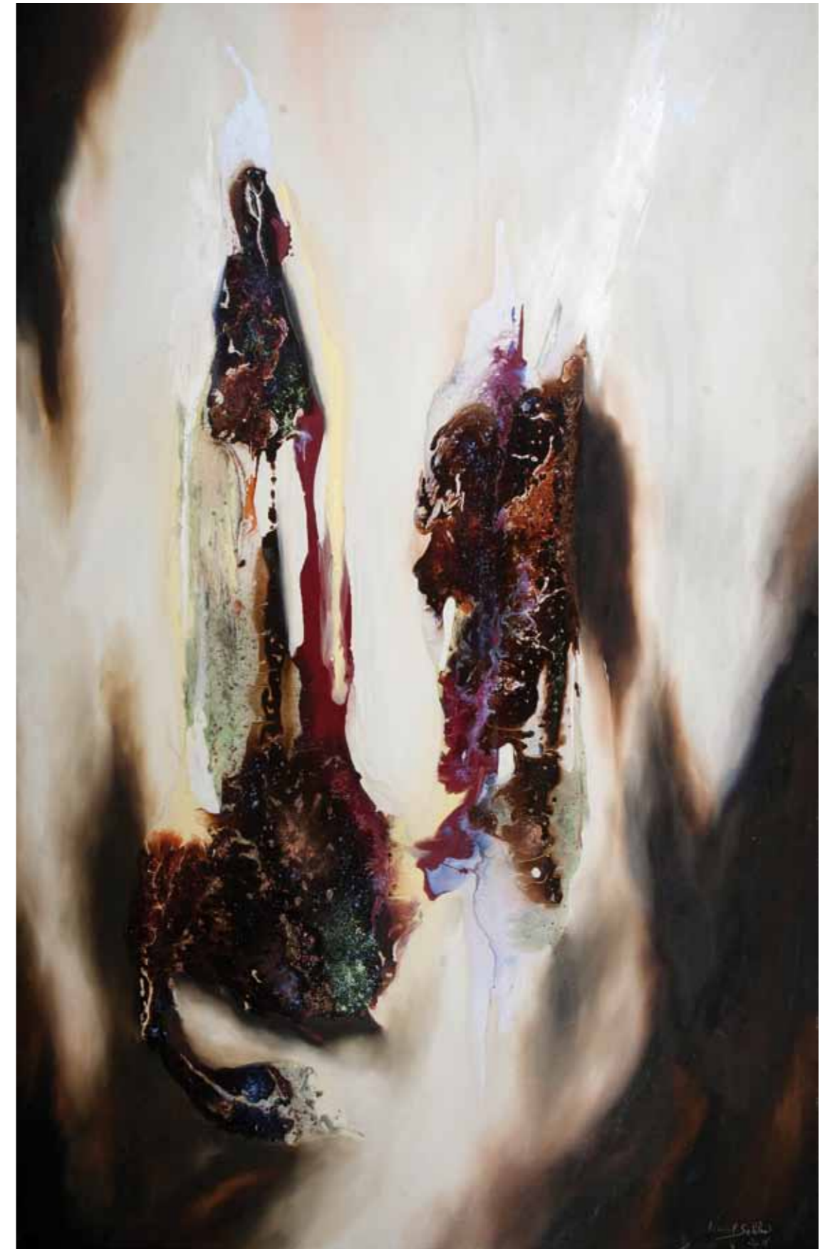
Série LAM élévation . Cire d'abeille, résine, pigments, nacre sur toile 180/120cm 2015