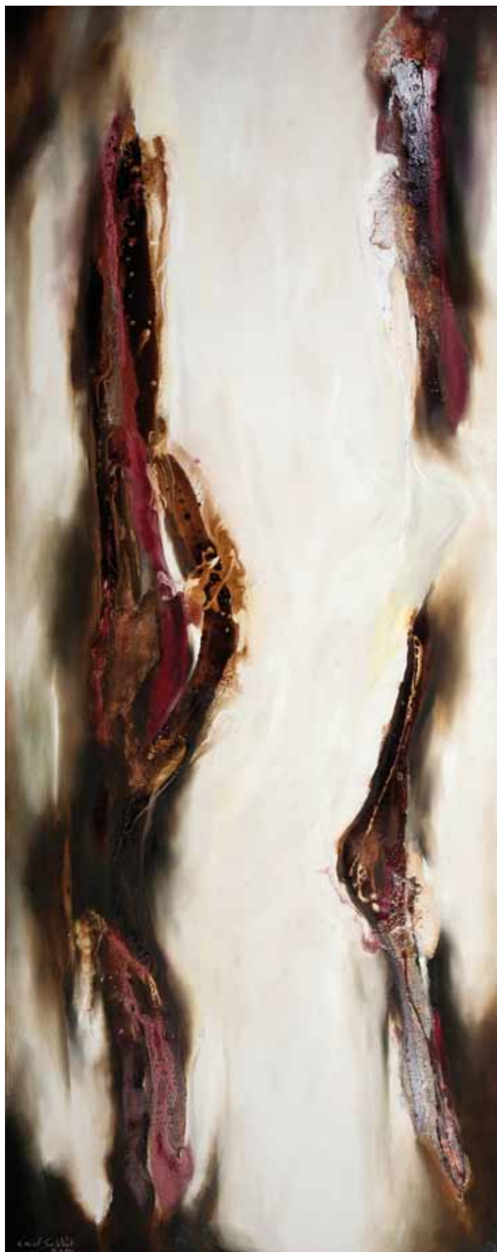
Série LAM.1 Cire d'abeille, résine, pigments mixte sur toile. 200/80cm 2014