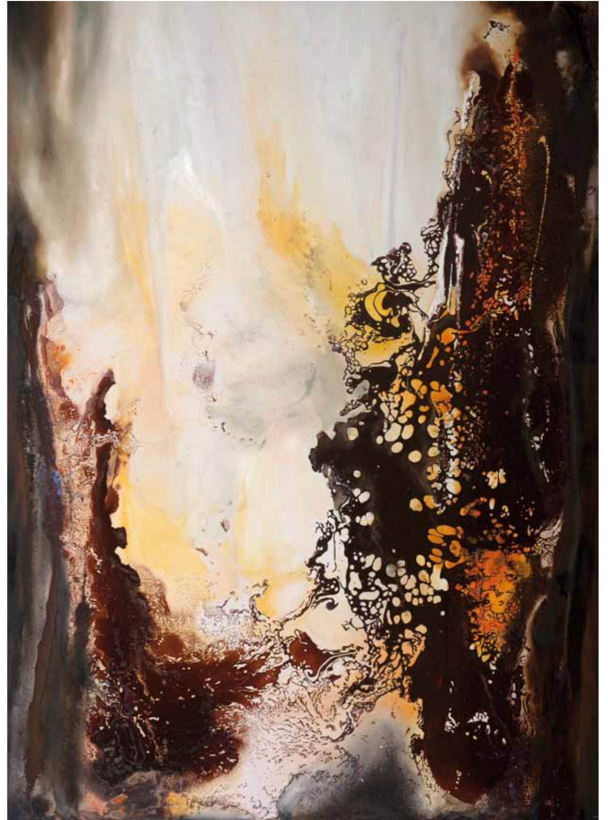
Flammes ondoyantes. cire d'abeille, résine, pigments, nacre,...sur toile. 180/130cm 2016