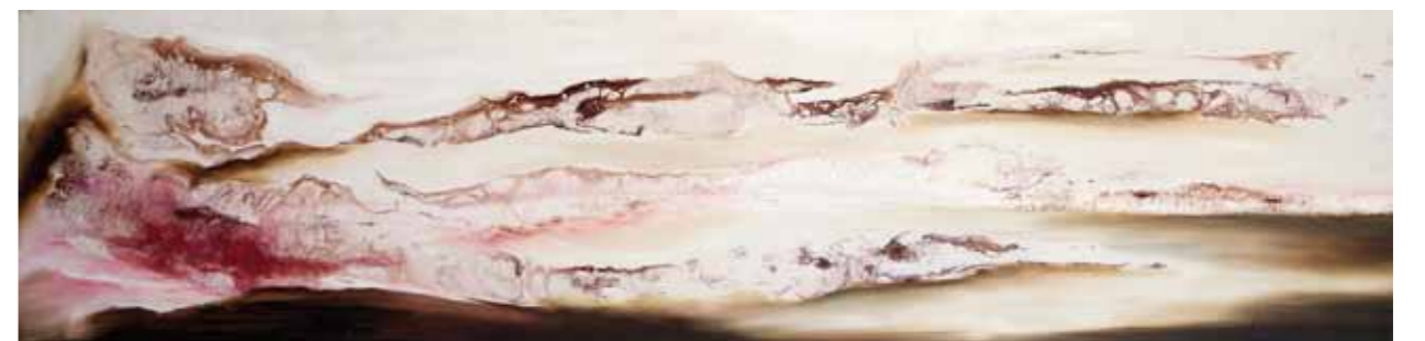
Nimbée. Cire d'abeille, galcis, nacre et huile sur toile. 40/160cm 2016