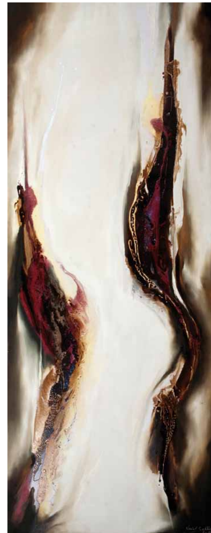
Série LAM.2 Cire d'abeille, résine, pigments mixte sur toile. 200/80cm 2014