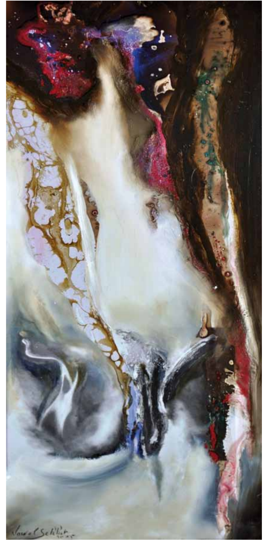
La Clarté du Jour dans le Miroir de l'eau. Œuvre du livre . Nuit d'espérance. 64/27cm 2015