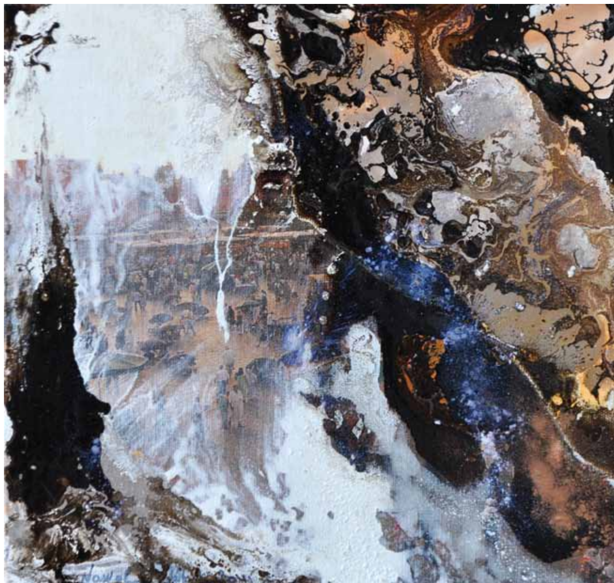
Jamaa el fna. Œuvre du livre . Nuit d'espérance. Eclat de chaleur et de couleurs. Mixte sur toile. 30/30cm 2015