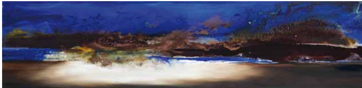
L'île de Dia . Cire d'abeille, pigments, nacre, huile sur toile. 40/160cm 2016