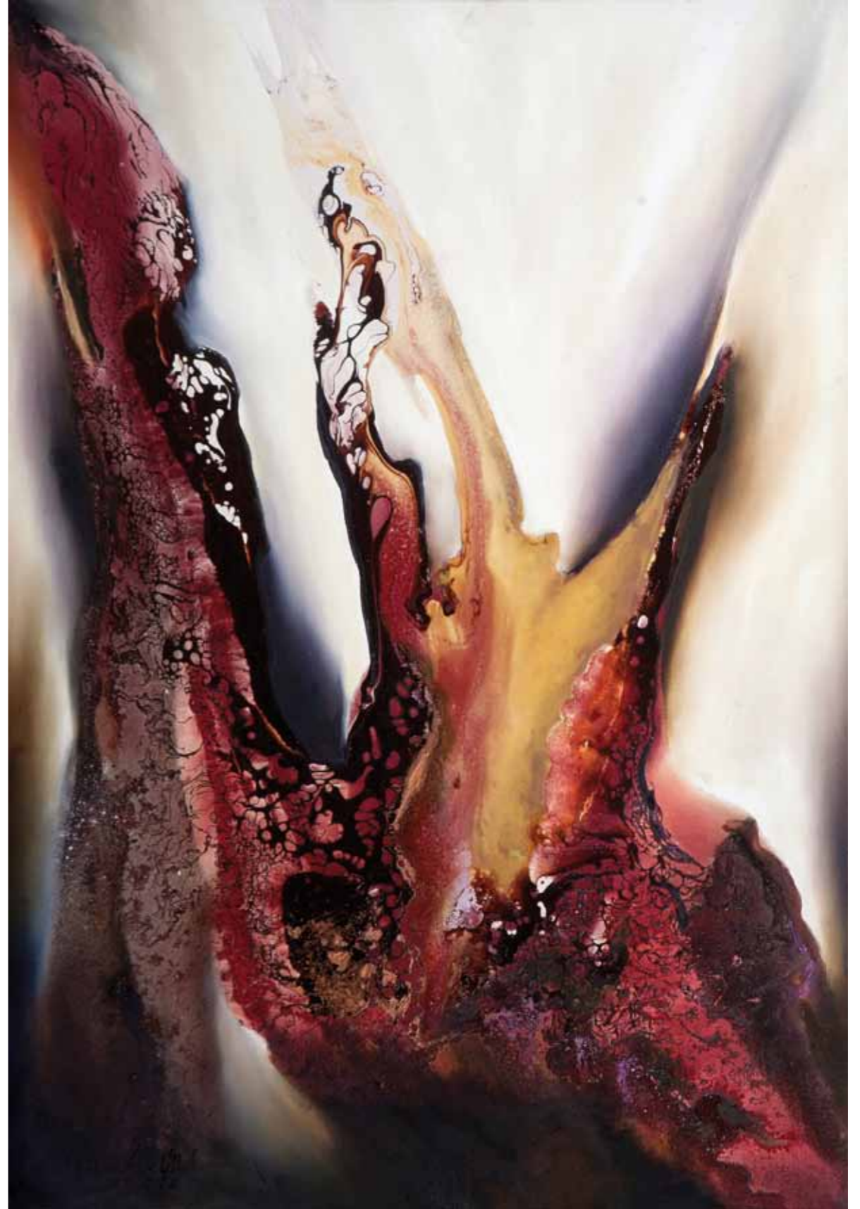
Ferveur 2. Cire, pigments, glacis et huile sur toile. 100/70cm 2016