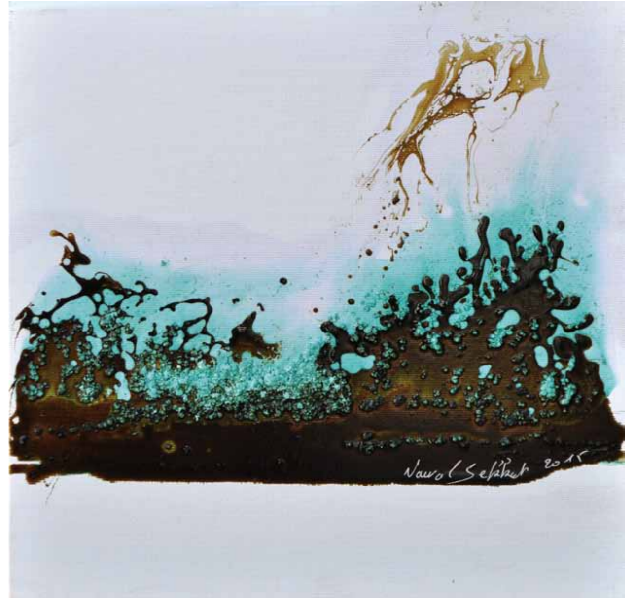
Ton beau printemps. Œuvre du livre . Nuit d'espérance. Mixte sur toile. 30/30cm 2015