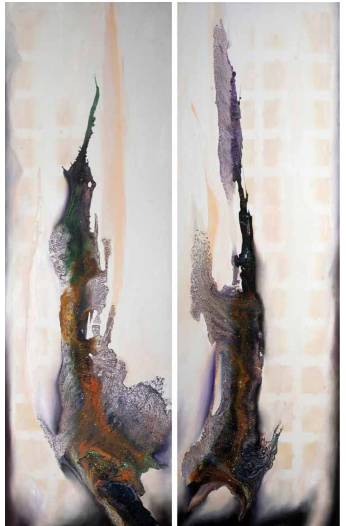
Ouvertures. Diptyque. Cire d'abeille, résine, pigments, nacre,... sur toile. 195/124cm 2016