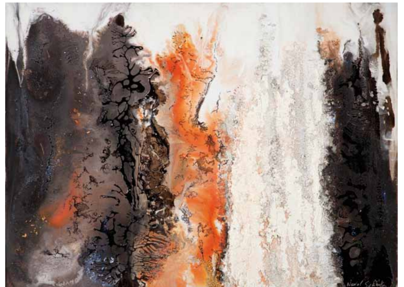
Limon, stone dust. Cire, sable, pigments, huile sur toile. 60/80cm 2015