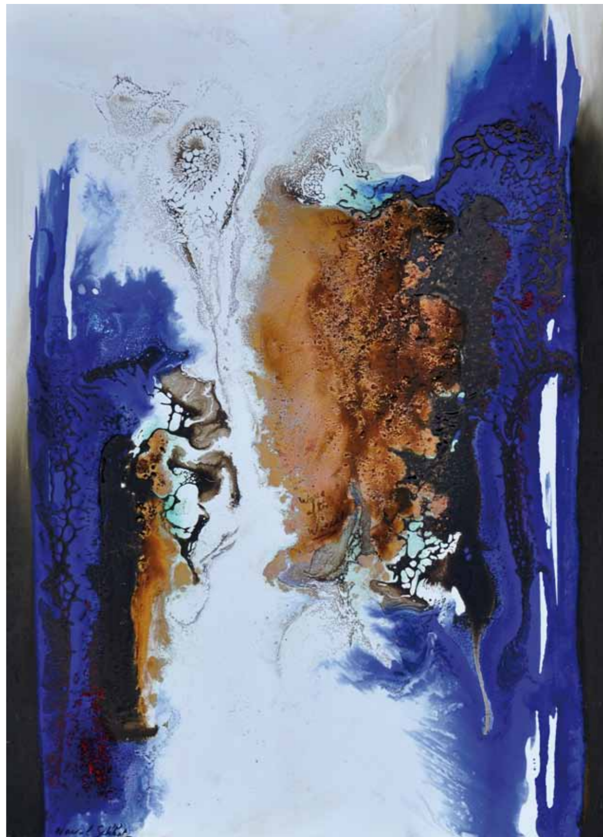
Et si demain était ta liberté ... Œuvre du livre . Nuit d'espérance. Résine , cuivre , nacre, cire d'abeille et pigments sur toile. 85/65cm 2015