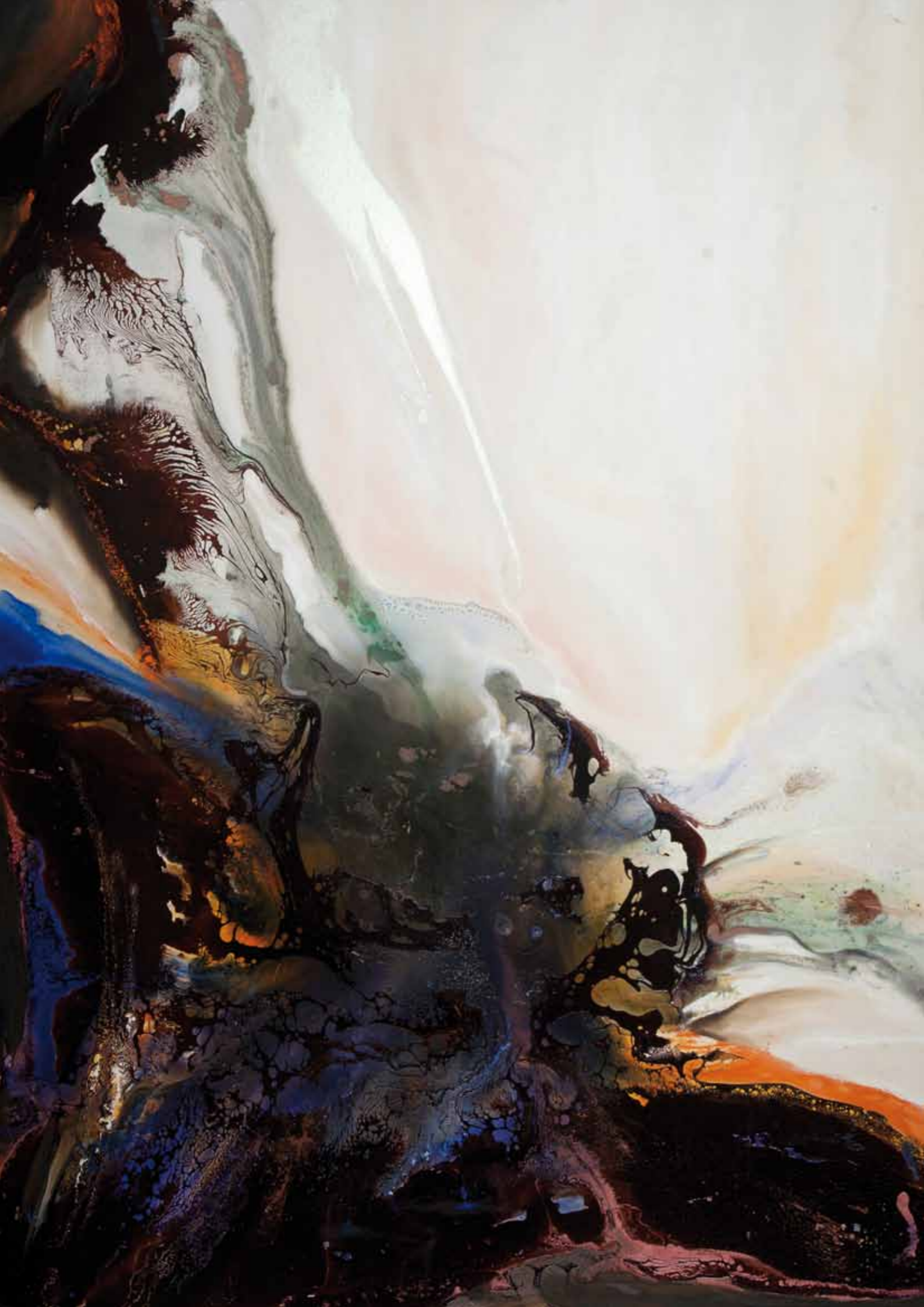
Désirée. Cire d'abeille, nacre, pigments, résine...sur toile. 180/130cm 2016